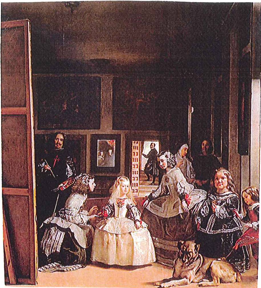
“Las Meninas” de Velázquez