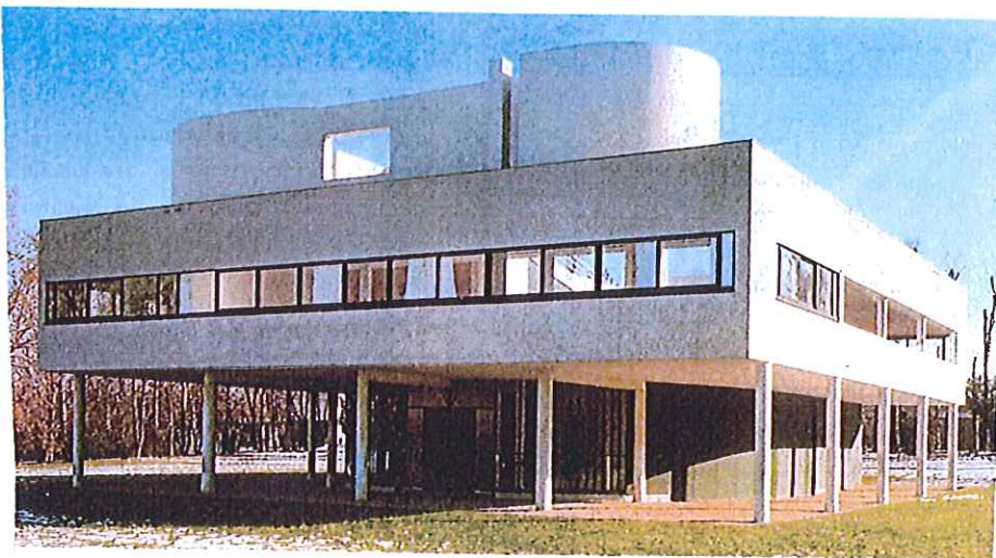
"Villa Saboya". Le Corbusier