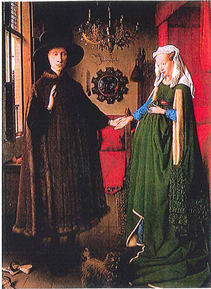
"El matrimonio Arnolfini". Juan Van Eyck