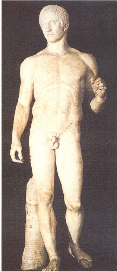
“El Doriforo” de Policleto