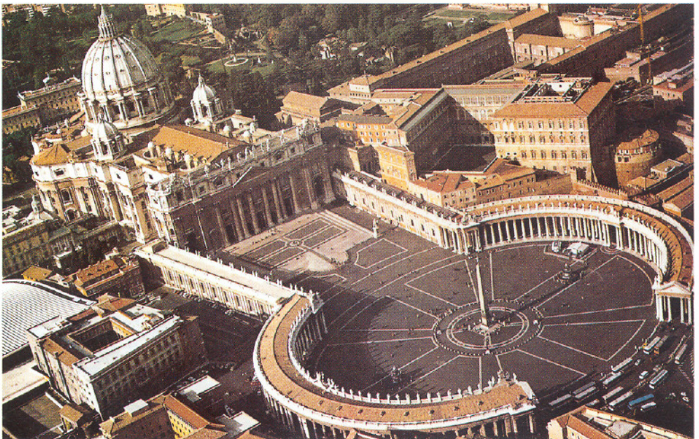
Plaza de San Pedro del Vaticano de Lorenzo Bernini