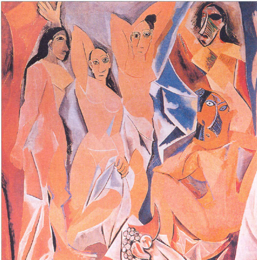
“Las Señoritas de Avinyó” (1907). Pablo Picasso.