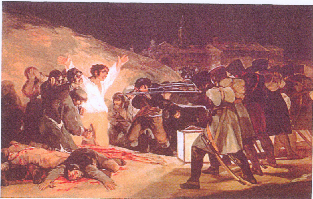
“Los fusilamientos del 3 de Mayo”. Francisco de Goya