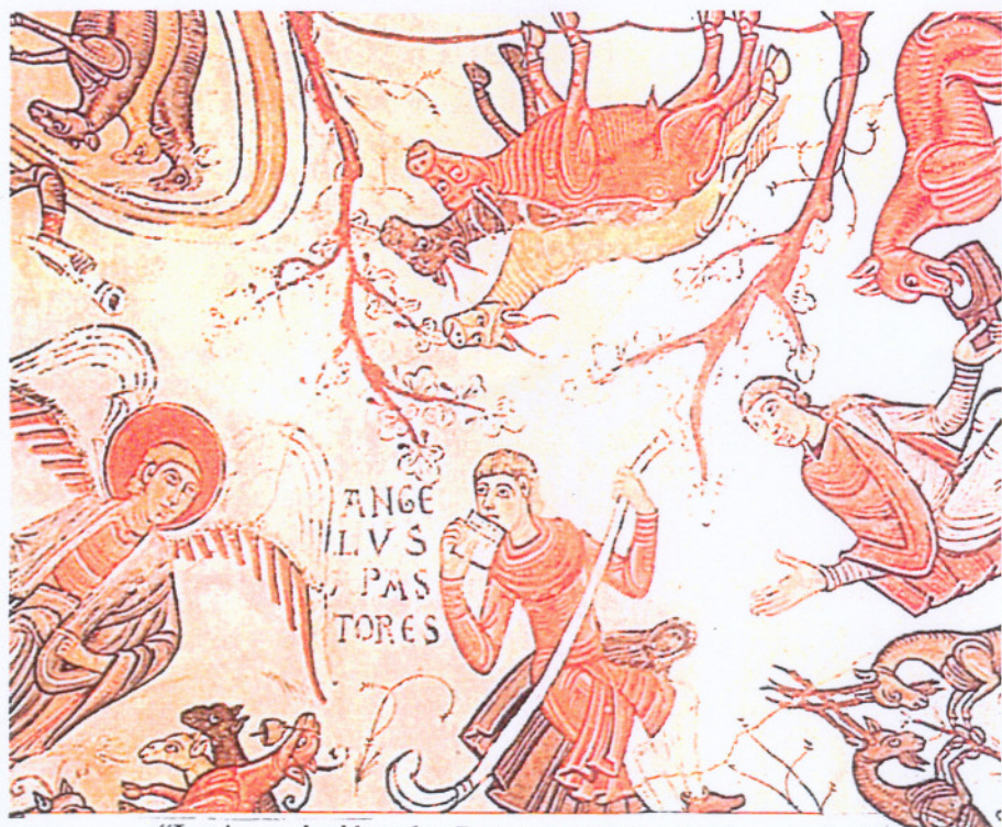
“La Anunciación a los Pastores” de San Isidoro de León