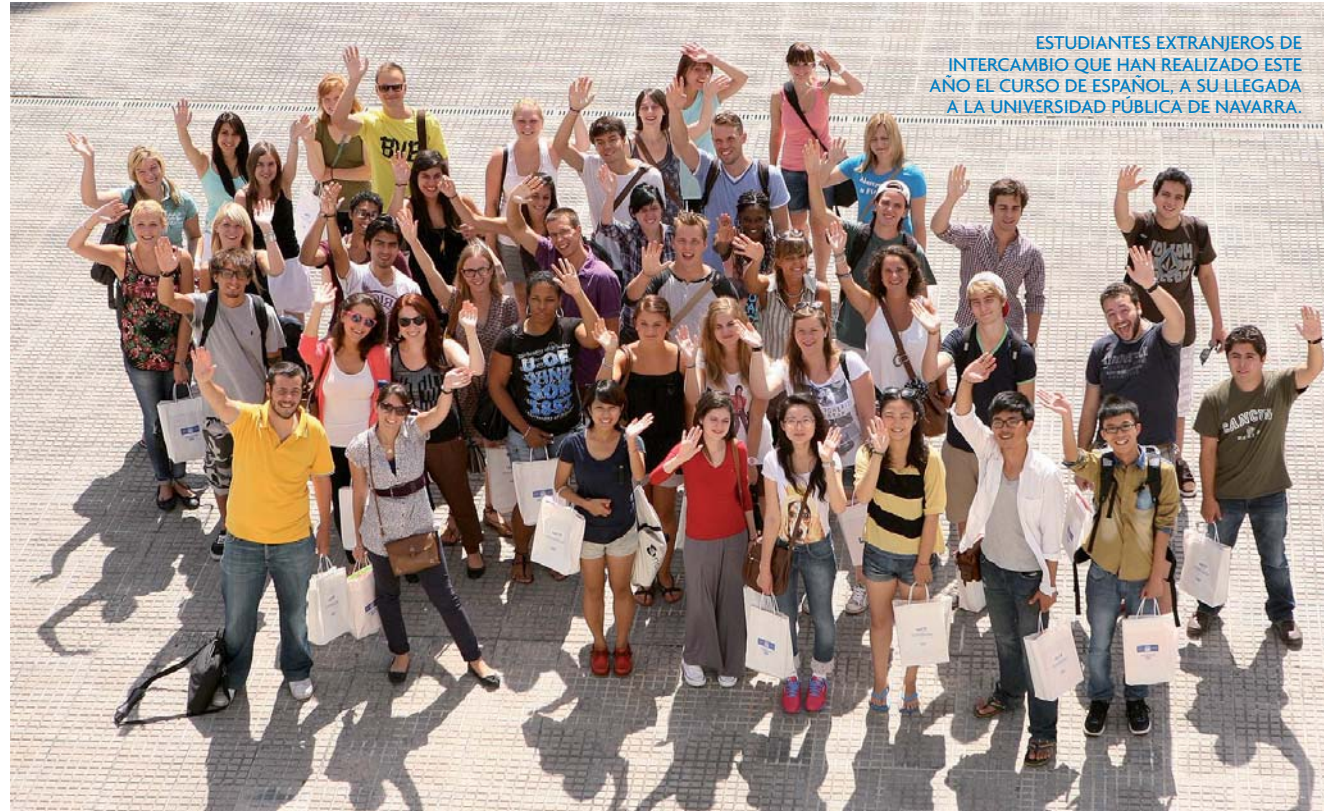
ESTUDIANTES EXTRANJEROS DE INTERCAMBIO QUE HAN REALIZADO ESTE AÑO EL CURSO DE ESPAÑOL. A SU LLEGADA A LA UNIVERSIDAD PÚBLICA DE NAVARRA.

DE LOS 7.650 ESTUDIANTES CON QUE CONTÓ LA UNIVERSIDAD PÚBLICA DE NAVARRA EL PASADO CURSO, UN 4% (309) ERAN EXTRANJEROS. DE ELLOS, 200 SE ENCONTRABAN DE INTERCAMBIO ACADÉMICO, 69 ESTUDIARON ALGÚN MÁSTER Y 40 CURSARON ESTUDIOS DE DOCTORADO. A LA ESPERA DE CERRAR LA MATRICULACIÓN DE ESTE AÑO, TODO PARECE INDICAR QUE LA CIFRA DE ESTUDIANTES EXTRANJEROS SEGUIRÁ CRECIENDO, SEGÚN LA LÍNEA ASCENDENTE DE ESTOS ÚLTIMOS AÑOS. LA UPNA DISPONE DE UN PROGRAMA DE ATENCIÓN, ACOGIDA Y ORIENTACIÓN A ESTUDIANTES INTERNACIONALES PARA FACILITAR ASÍ SU INTEGRACIÓN EN PAMPLONA Y, MÁS CONCRETAMENTE, EN LA PROPIA UNIVERSIDAD.