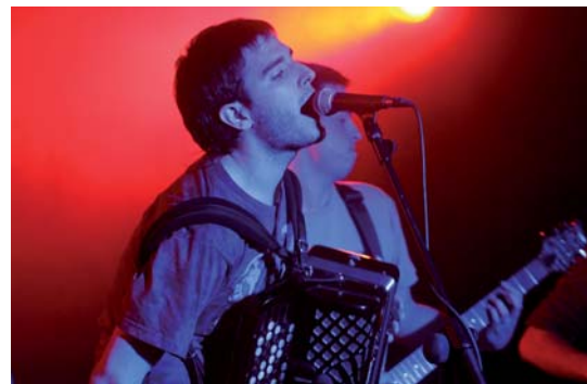
BRIGADA IMPRODUCTIVA, GRUPO GANADOR DEL ÚLTIMO CAMPUS MUSIC, ACTUARÁ EL PRÓXIMO 22 DE SEPTIEMBRE EN LOGROÑO, EN LAS FIESTAS DE SAN MATEO.

24 ABRIL. Película imprescindible de 2012 (a seleccionar).