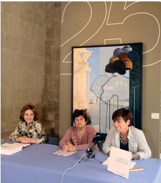
EL PROGRAMA DE ACTIVIDADES DEL XXV ANIVERSARIO INCLUYE, ENTRE OTRAS, UNA JORNADA DE ACOGIDA A LOS NUEVOS ESTUDIANTES COINCIDIENDO CON EL INICIO DEL NUEVO CURSO (FOTOGRAFÍA SUPERIOR), VARIAS EXPOSICIONES (FOTOGRAFÍAS CENTRALES), Y UNA JORNADA DE TRABAJO SOBRE LOS PROGRAMAS DE AMIGOS Y ANTIQUOS ALUMNOS ORGANIZADA POR EL CONSEJO SOCIAL DE LA UPNA Y CELEBRADA A COMIENZOS DE VERANO (FOTOGRAFÍA INFERIOR). EN LA FOTOGRAFÍA DE LA PÁGINA 10, LA EXPOSICIÓN ITINERANTE "25 AÑOS DE VIDA" EN CIVIVOX CONDESTABLE.